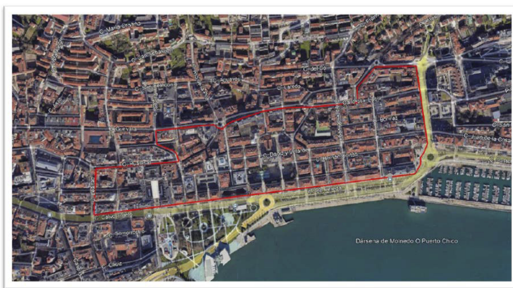
Perímetro de la ZBE de Santander, sobre imagen satélite.

Se adjunta un mapa de la ubicación de la Zona de Bajas Emisiones: